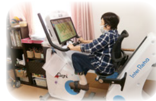
無理なく楽しめるトレーニングメニュー