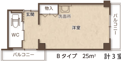
Bタイプ 25m 2 計3室