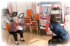
機能向上を狙った運動