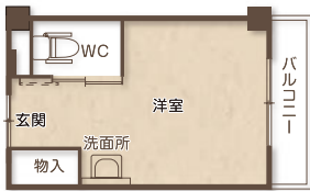
Aタイプ 18m 2 計23室