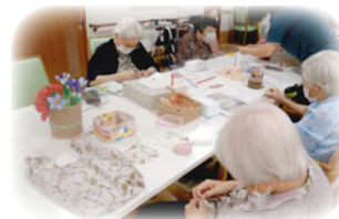
手芸教室などのアクティビティ