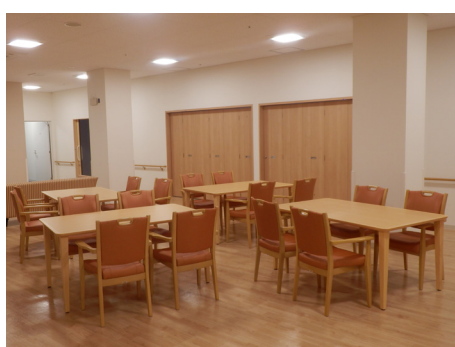
通いサービススペース